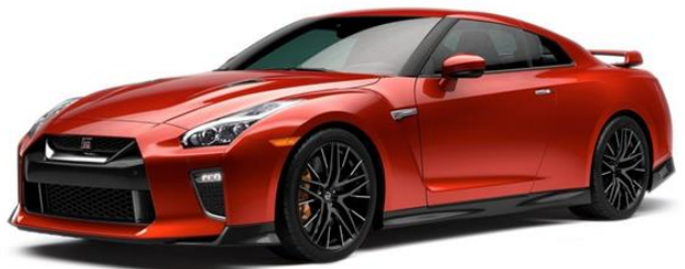
2021 GT-R Coupe

自動車に限らず“デザイン”には意味があると思っています。その意味をどうやって持たせるか？あるいはその形をどう理解するか？