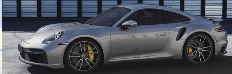
2021 Porsche 911 Turbo